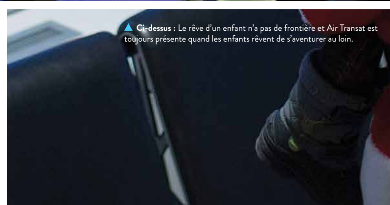
▲ Ci-dessus : Le rêve d'un enfant n'a pas de frontière et Air Transat est toujours présente quand les enfants rêvent de s'aventurer au loin.

d'envergure qui rassemblent les donateurs et génèrent des centaines milliers de dollars pour Rêves d'enfants. L'an dernier, Air Transat a parrainé quatre grands tournois de golf suivis de réceptions en Alberta, en Colombie-Britannique, en Ontario et au Québec. Dans les airs ou sur le terrain , merci, Air Transat, de nous aider à aller toujours plus loin.